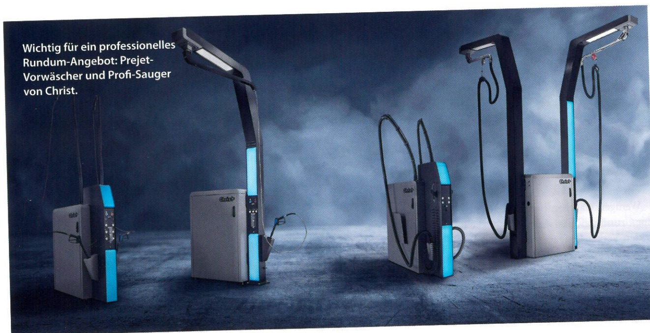
Wichtig für ein professionelles Rundum-Angebot: Prejet-Vorwäscher und Profi-Sauger von Christ.