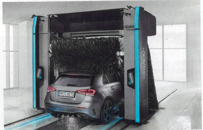
Die Portalwaschanlage Cadis ist die optimale Lösung: zuverlässig, langlebig und kostengünstig

Klare Linien und Formen in Abstimmung mit einem ausgewählten Farbbereich bringen Funktion und Design in Einklang. Die Blade Designele-